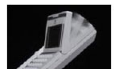
チルトディスプレイ