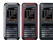
X PLATE スペシャルモデル SWX130S