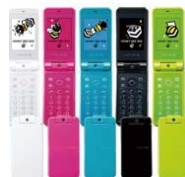
HONEY BEE BOX /WX334K